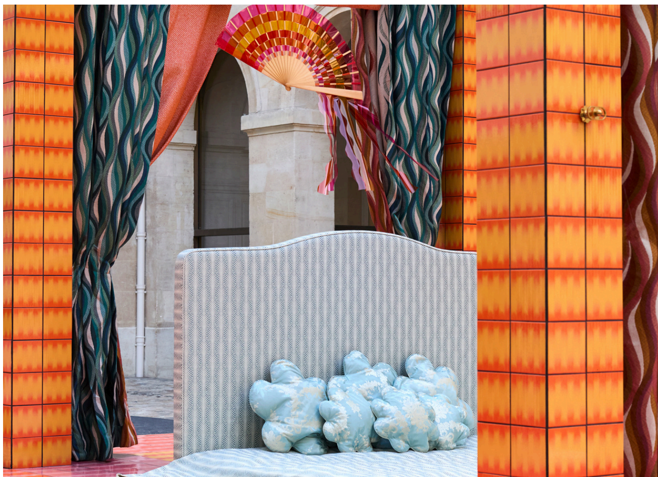
Uchronia - Hôtel de la Marine

Une ambition qui animera aussi la prochaine édition du 4 au 13 septembre 2025.