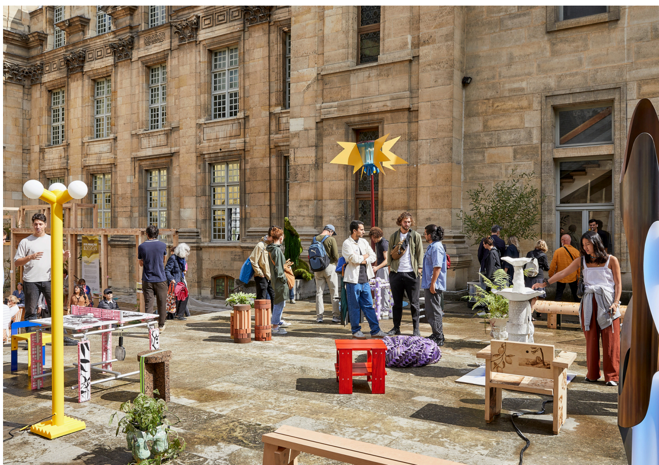
Village Palace - La BHVP

Aux expositions des lauréats des prix « Vitrine pour un Designer » ou du prix « Mathias », organisé par Matières Libres ... et bien d'autres qui expriment eux aussi une création libre et spontanée, toute parisienne.