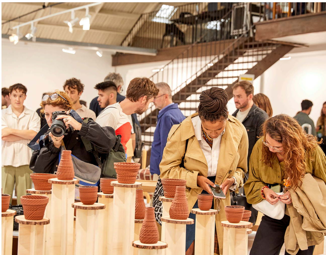
Paris Design Week Factory - Espace Communes

Année après année, Paris Design Week, affirme sa singularité parmi les design weeks européennes et sa complémentarité avec le positionnement de Maison&Objet en septembre qui assure la promotion de la nouvelle garde internationale.